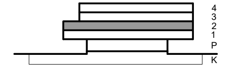
Položaj etaže v stavbi (stranski ris)